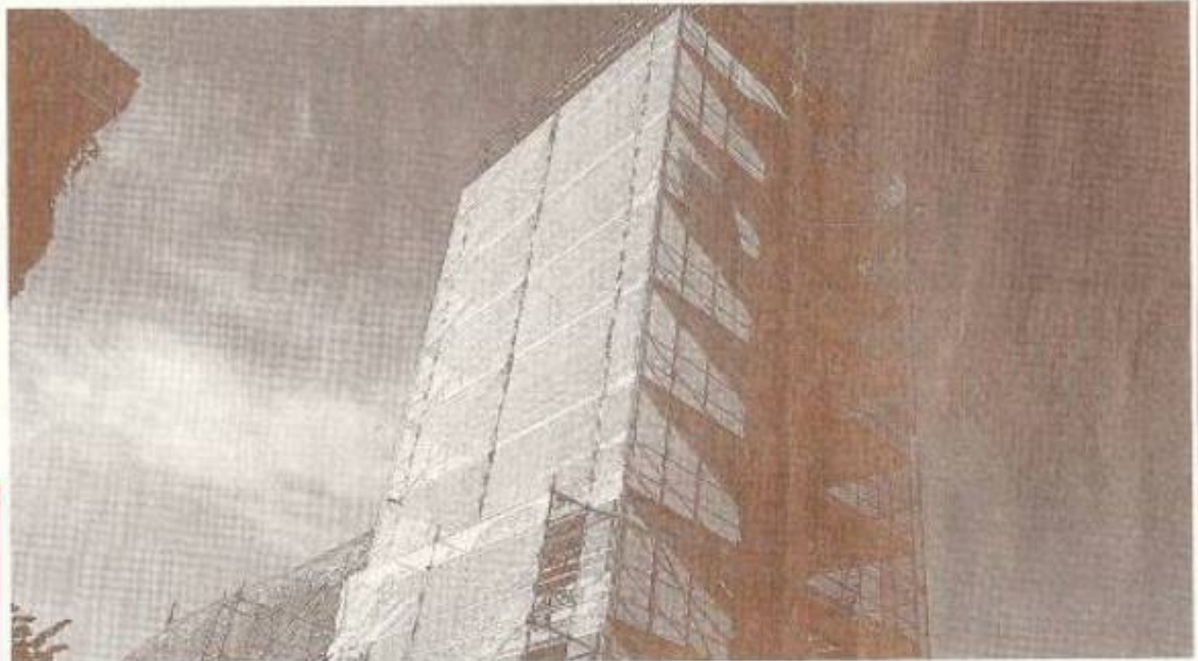
Le clocher, entouré d'échafaudages, est en cours de rénovation.

C'est un prêt relais de 220 000 € sur deux ans, remboursables au fur et à mesure de la vente des terrains. « Nous avons reçu des propositions de trois banques soit avec des taux fixes, soit indexé Euribor. De plus, rien ne nous indique que nous