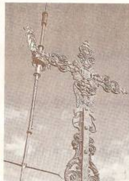
Un nouveau coq surplombe le village à côté de la croix rénovée.

Lors de sa dernière réunion, le conseil a débattu de la suite de la rénovation de l'église. Parmi les différentes propositions, figuraient la réfection de