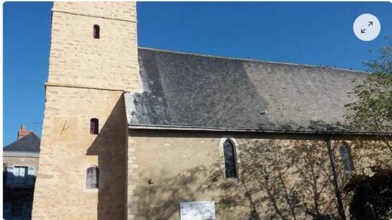
La tour-clocher a subi une rénovation totale.