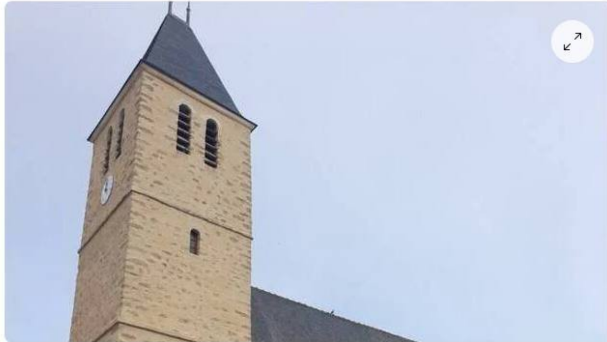
L'échafaudage de l'église a été démonté. Les travaux extérieurs sont terminés.