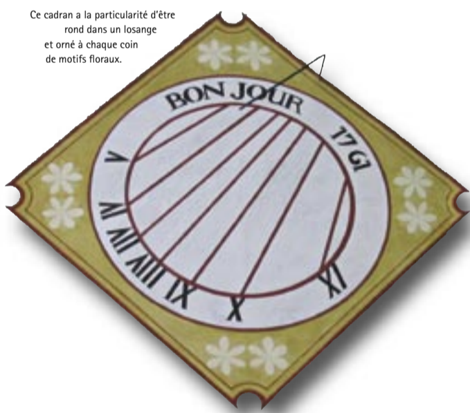
Ce cadran a la particularité d'être rond dans un losange et orné à chaque coin de motifs floraux.

Action soutenue par le Parc à hauteur de 25 000 €. Contact : Armelle Bouquet au 04 76 94 38 14