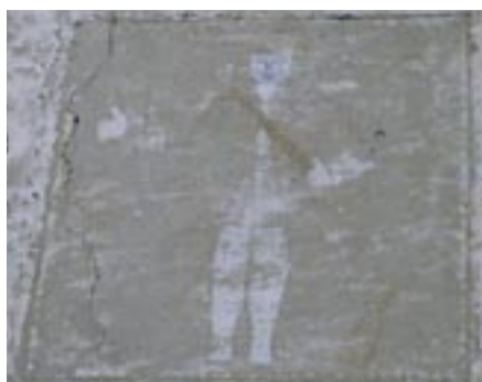
Fresque d'un homme en armes datant on suppose de 1761 car l'uniforme permet de la situer dans le temps. Travaux de restauration avant et après.