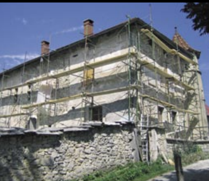
Chantier sur la maison Chabert, hameau du Cordet à Rencurel.